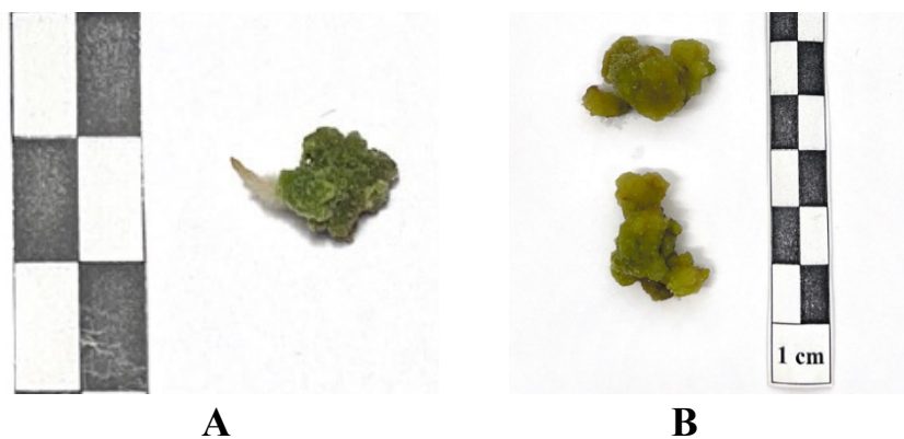
Рис 3. Растительный материал Antirrhinum majus L., культивируемый в условиях in vitro