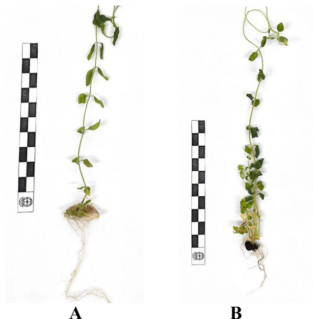
Рис. 2. Растительный материал Antirrhinum majus L., культивируемый в условиях in vitro А. Корневая система сорта 'Вильдрозе', среда MS7 В. Корневая система сорта 'Розенскиммер', среда MS8